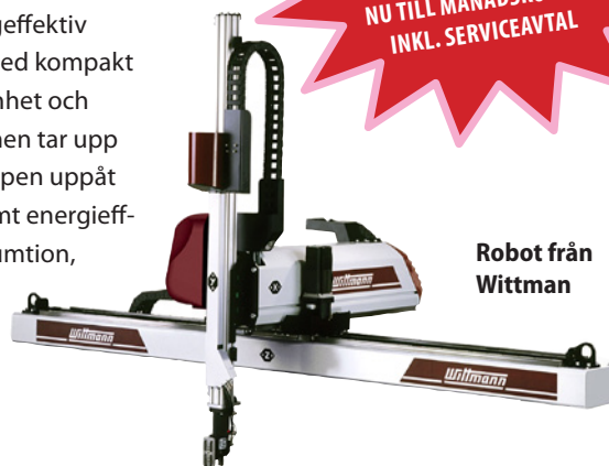
Robot från Wittman